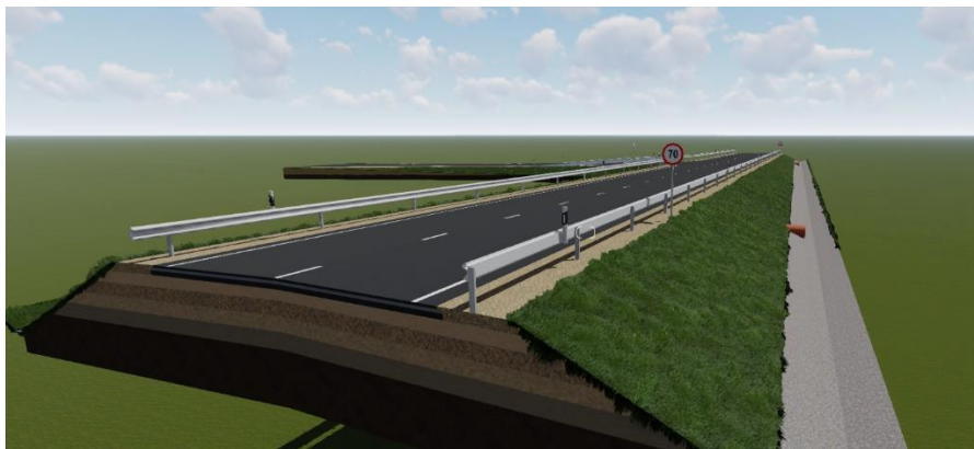
Pilt 1. Visualiseerimise näidis